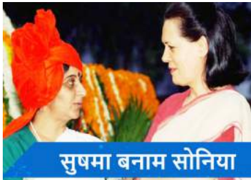
सुषमा बनाम सोनिया

इसका सबसे बड़ा नमूना 2004 के लोकसभा चुनाव में देखने को मिला है। साल 1999 में अटल बिहारी वाजपेयी की सरकार गिर चुकी थी। देश में एक बार फिर लोकसभा के चुनाव हो रहे थे। 18 अगस्त, 1999 को अखबारों में छपा की कांग्रेस की नव निर्वाचित अध्यक्ष सोनिया गांधी दो सीटों से लोकसभा चुनाव लड़ेंगी। पहली अमेठी, जहां से उनके पति राजीव चुनाव जीतते थे। दूसरी कर्नाटक की बेल्हारी सीट। यह सीट कांग्रेस का गढ़ हुआ