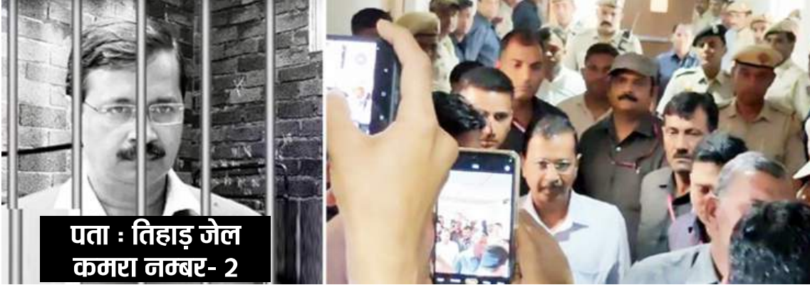
पता : तिहाड़ जेल कमरा नम्बर- 2