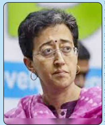
ਇਕ ਮਹੀਨੇ ਅੰਦਰ ਇਨਫੋਰਮੇਟ ਡਾਇਰੈਕਟੋਰੇਟ ਈ.ਡੀ. ਵਲੋਂ ਗ੍ਰਿਫਤਾਰ ਕੀਤੇ ਜਾਣ ਲਈ ਤਿਆਰ ਰਹਿਣ ਲਈ ਕਿਹਾ ਗਿਆ ਸੀ।